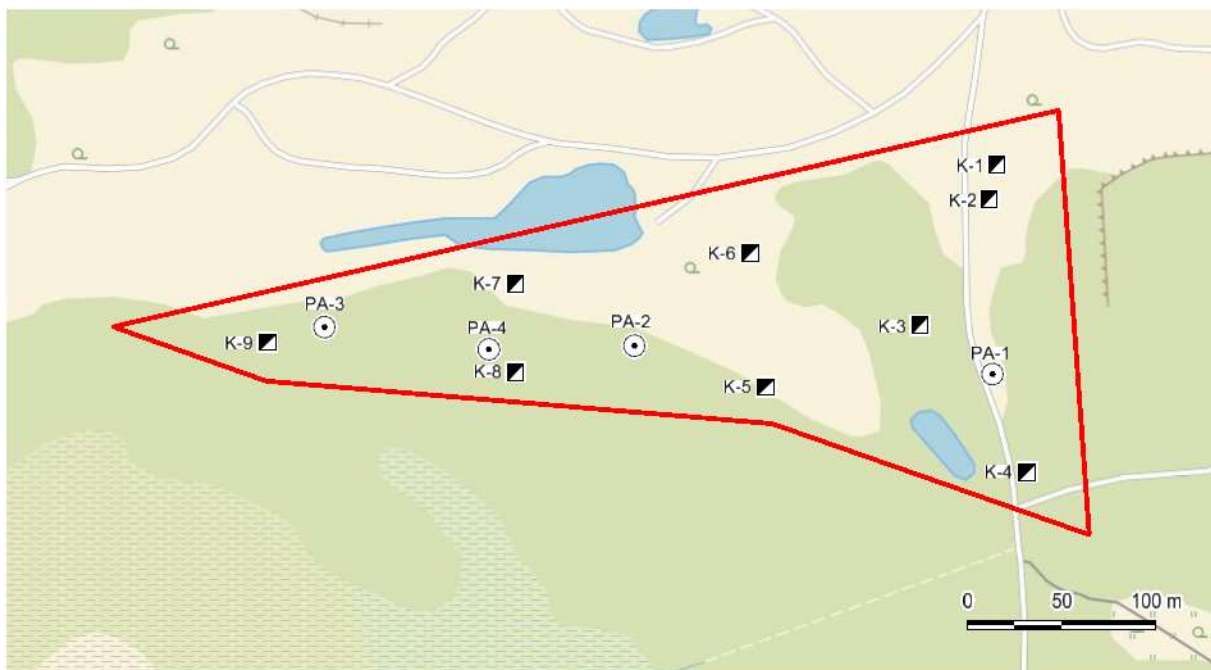
Joonis 1. Jaakna IV uuringuruumi puuraukude ja kaevandite asukohad. Plaani koostamisel on kasutatud Maa- ja Ruumiameti kaardirakendust.